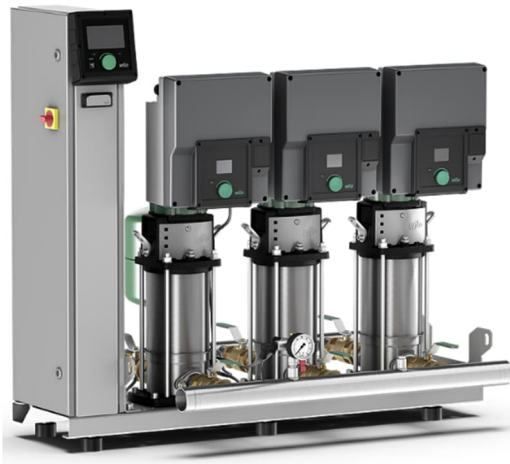
Abbildung 1: Beispiel Druckhalteanlage (Wilo-SiBoost2.0 Smart 3 Helix VE)

Die bestehende, nicht regelbare Stufenpumpe soll durch eine Druckhalteanlage, bestehend aus mehreren parallel geschalteten Pumpen ersetzt werden.